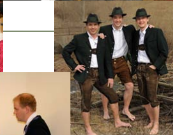
Männerwadln werden 40! im Oststeirer...