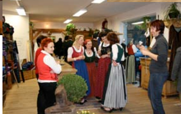
Und ein Traumteam!

Tu nur was Dir gut tut, denn das tut gut!