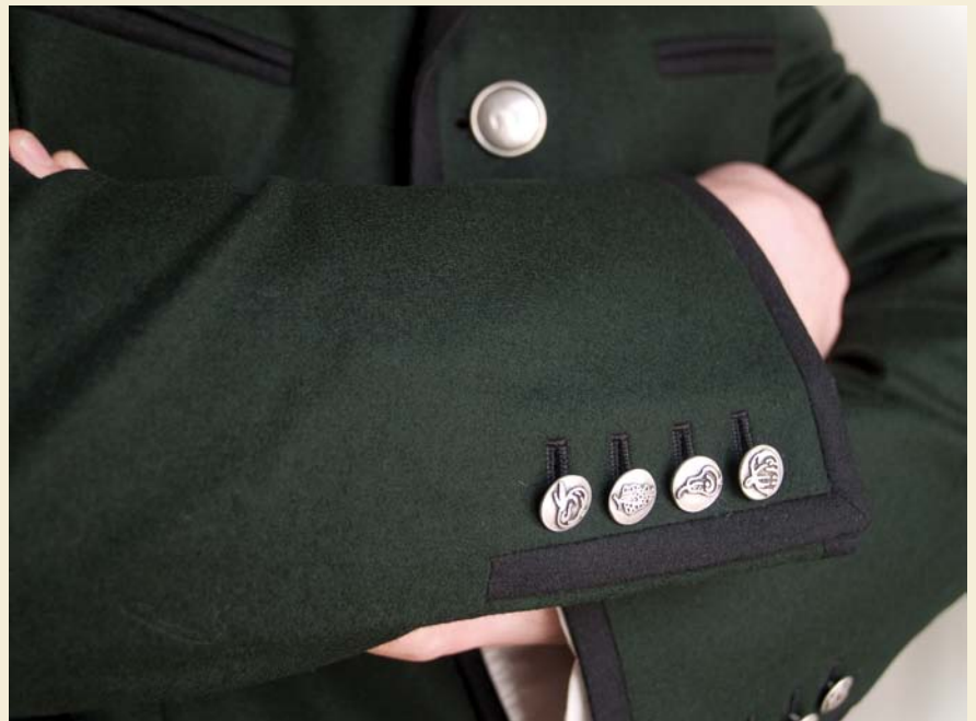
Ein handgeprägtes Monogramm am ersten Knopf ist das Markenzeichen des Oststeirerjankers.